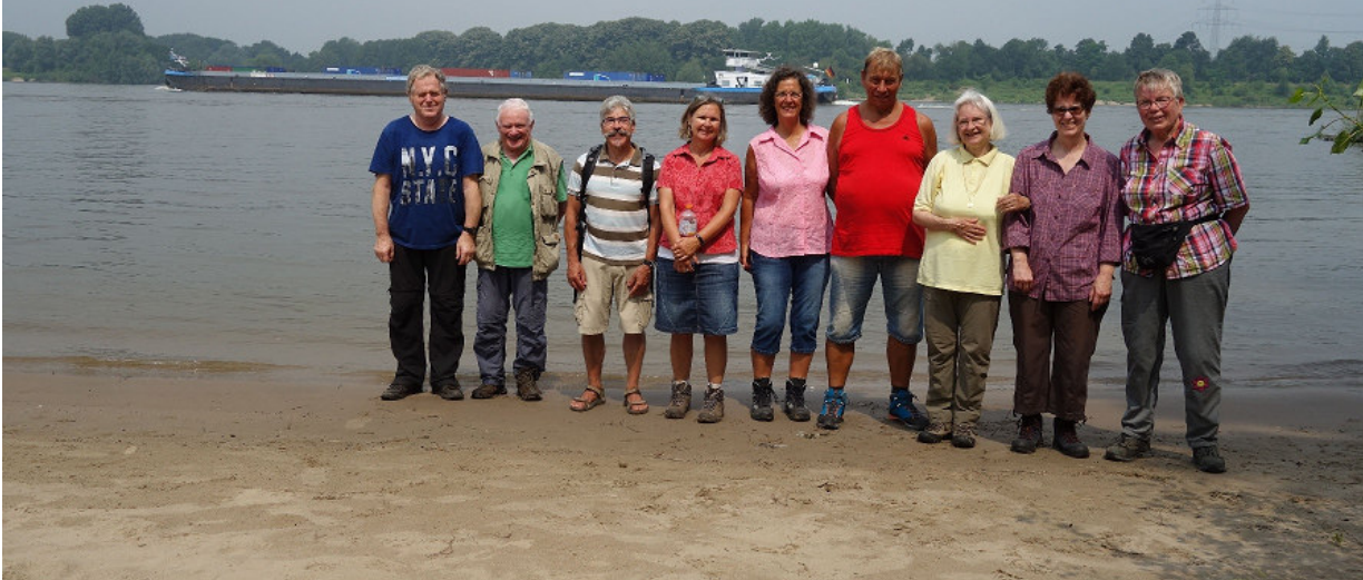
Die Wanderer in Duisburg Egingen und Mündelheim.