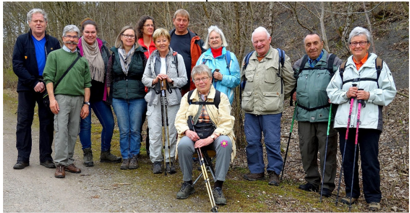
Die Wandergruppe auf der Halde Pattberg bei Repelen.

Aber trotz aller Vorsichtsmaßnahmen kamen uns auf der Halde 2 Teilnehmer abhanden! Aber nach Handy-Einsätzen wurden sie wieder eingefangen. Wir machten dann eine kleine Runde um den Rossenrayer-See. Aber leider war der Baggersee überall eingezäunt. Nach diversen Pausen, bei unserer Mittagspause kam sogar ein Eiswagen vorbei, trafen wir ziemlich früh wieder auf dem Parkplatz am Fuß der Halde Pattberg ein.