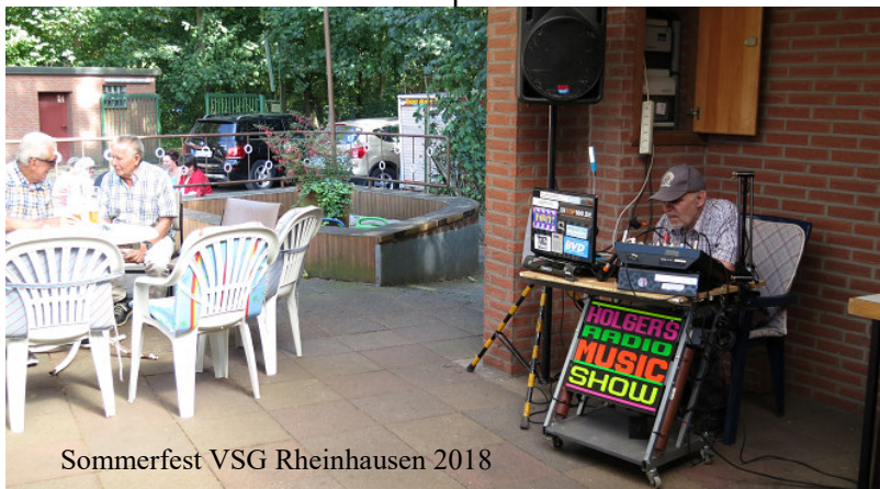
Sommerfest VSG Rheinhausen 2018