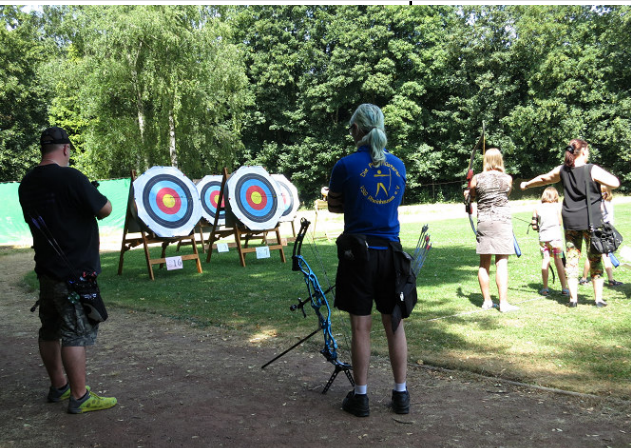
Der Bogenstand war gut besucht.