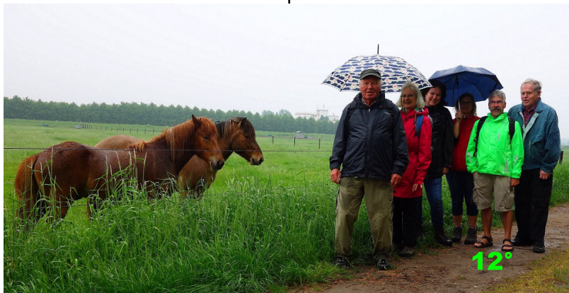
Wanderung nach Arcen in Holland..