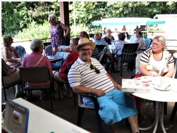
Viele Gäste auf der Terrasse.