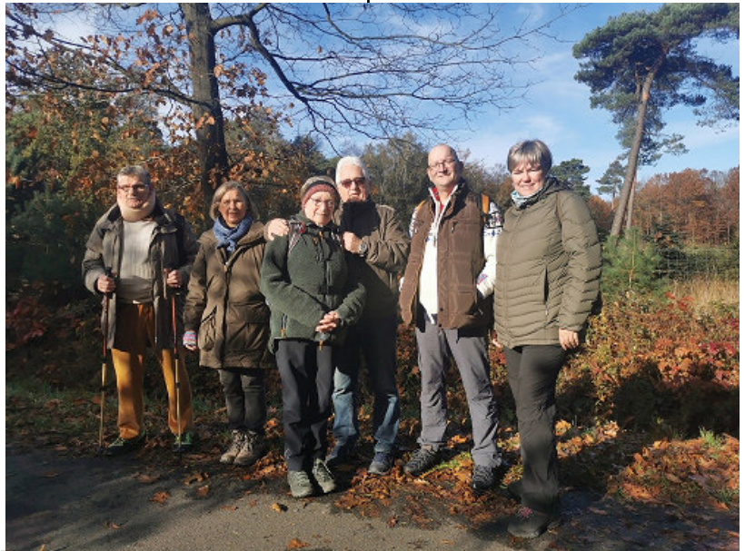
Die Teilnehmer an der Wanderung im Waldgebiet um Neufeld.