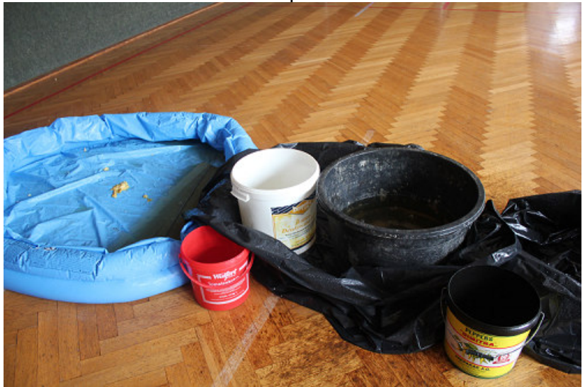
Wasserschaden in der Mehrzweckhalle

Spendenkonto der VSG: DE96 3505 0000 0250 0108 81