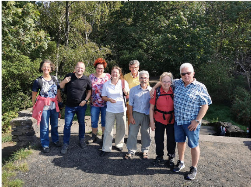
Die Teilnehmer der Wanderung in den Ruhrauen

Fazit: eine gelungene, wunderschöne Wanderung. Alle Wanderer hatten Spaß und waren wohlauf bei einer gemäßigten 9,4 km-Tour.