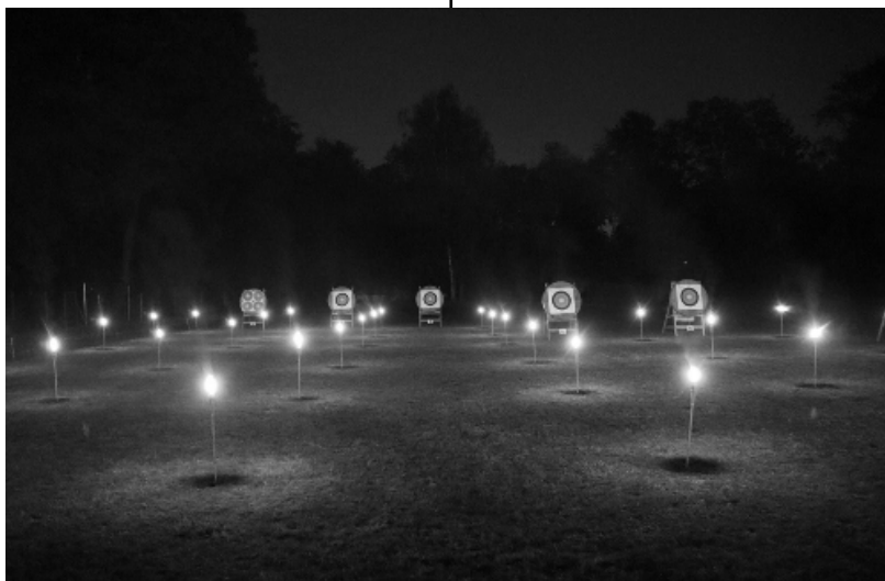
Fackelturnier der Pfeilflüsterer