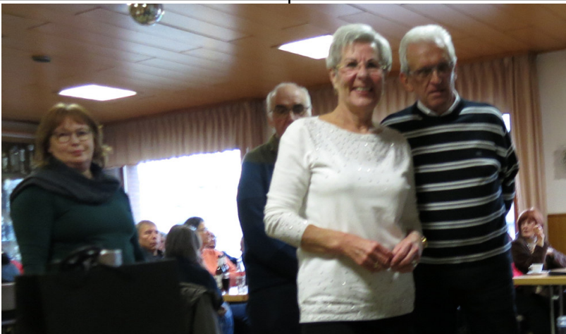
Ehrungen für 10jährige Mitgliedschaft bei der Jahreshauptversammlung