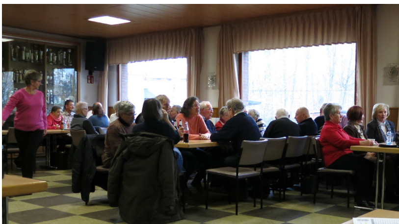
Unsere Jahreshauptversammlung 2020