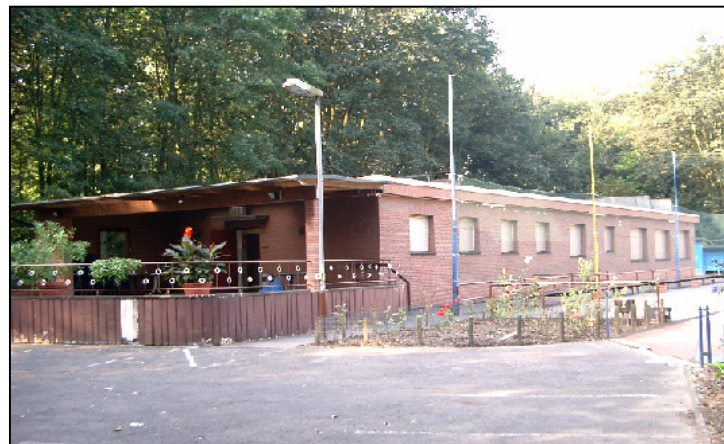
Klubhaus mit Terrasse