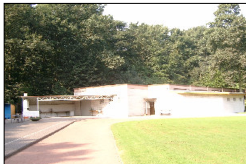
Mehrzweckhalle mit Rasenplatz